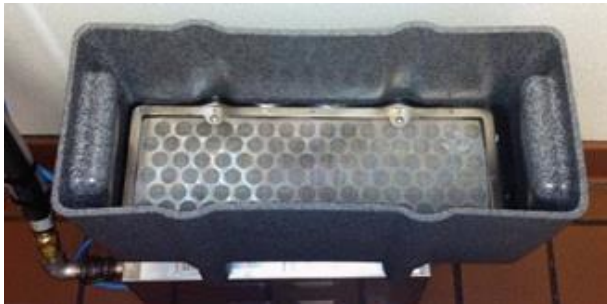
Limpiar pantalla metálica