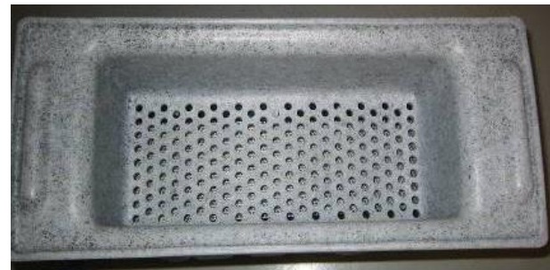
Limpiar el colador superior